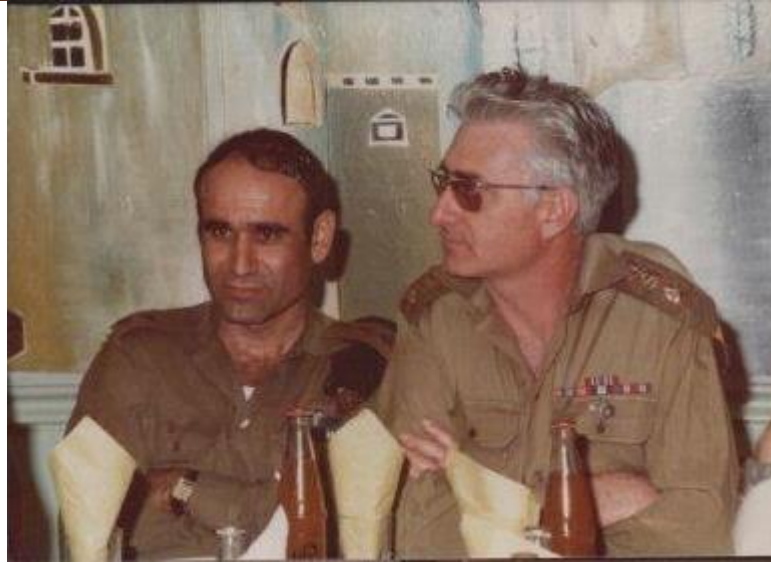
שנת 1983, בכנס