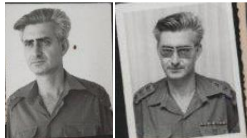
קבלת תפקיד בגייסות השריון