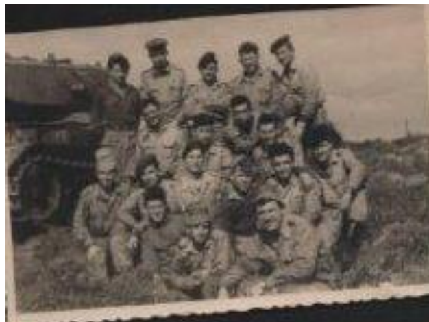
מדריך בקורס מכונאים (שני משמאל למעלה)